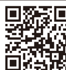
氣比神社 〒649-6511 和歌山県紀の川市猪垣191